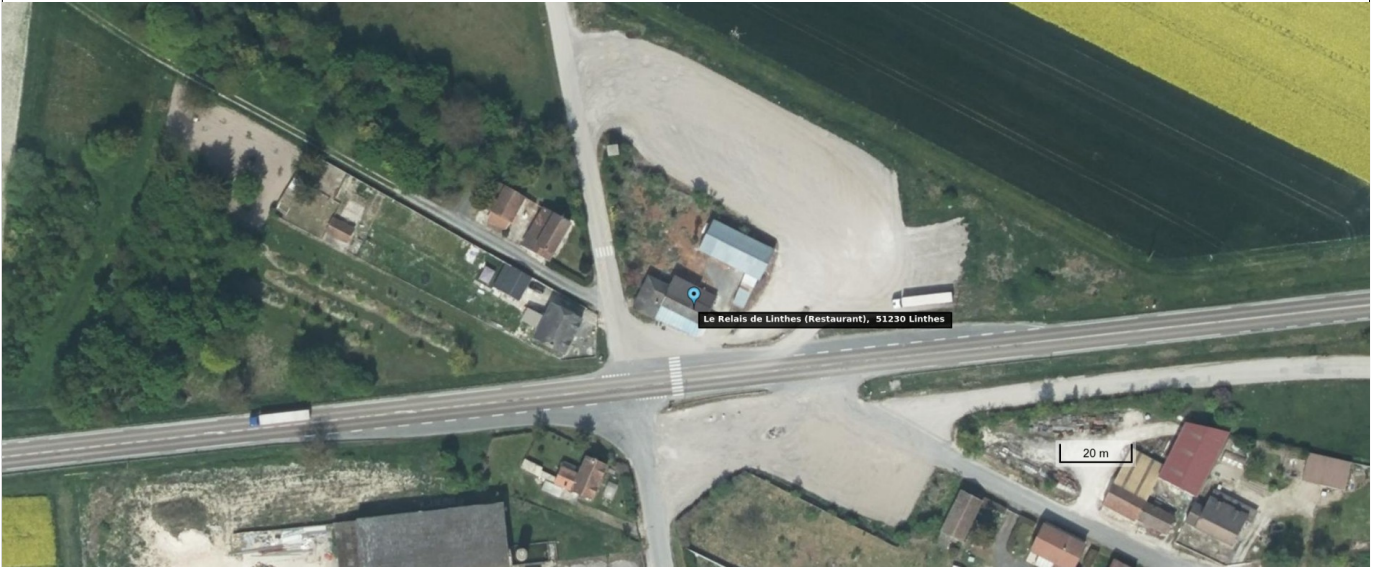
Annexe 5- Vue satellite site MOEURS VERDEY