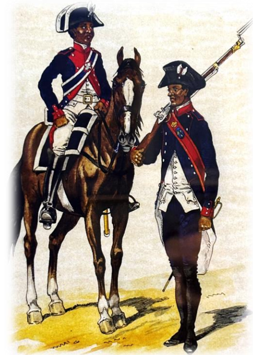
LA MARECHAUSSEE DE SAINT-DOMINGUE EN 1788

À partir du XVI e siècle, la France est engagée dans le processus de colonisation qui permet à l'Europe d'imposer sa suprématie au monde jusqu'à la Première Guerre mondiale. L'impérialisme colonial est motivé par des mobiles économiques, religieux et surtout politiques.