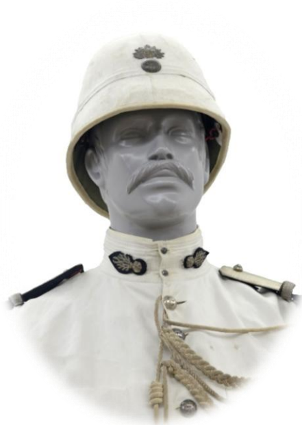
GENDARME D'OUTRE-MER ET SON CASQUE EN « PAIN DE SUCRE »

Dans les colonies, les gendarmes auxiliaires portent des uniformes marqués par les influences des tenues locales. Ainsi, en Indochine, les gendarmes auxiliaires indigènes portent le salacco ou « chapeau chinois ». Au Levant, c'est la chéchia. En outre, certaines unités de la gendarmerie de l'outre-mer ont su se doter de tenues de cérémonie éclatantes comme la garde rouge du Sénégal ou les gendarmes méharistes du Niger et d'Algérie.