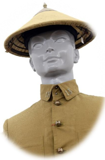
GENDARME AUXILIAIRE D'INDOCHINE PORTANT UN SALACCO