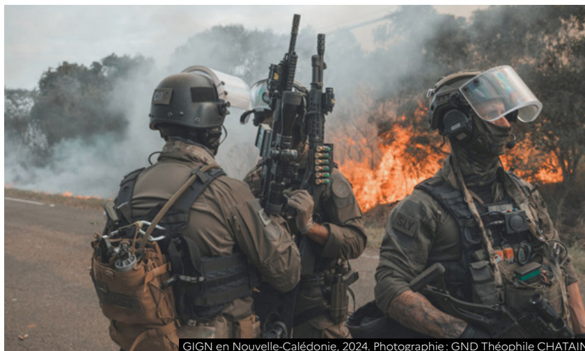
GIGN en Nouvelle-Calédonie, 2024.