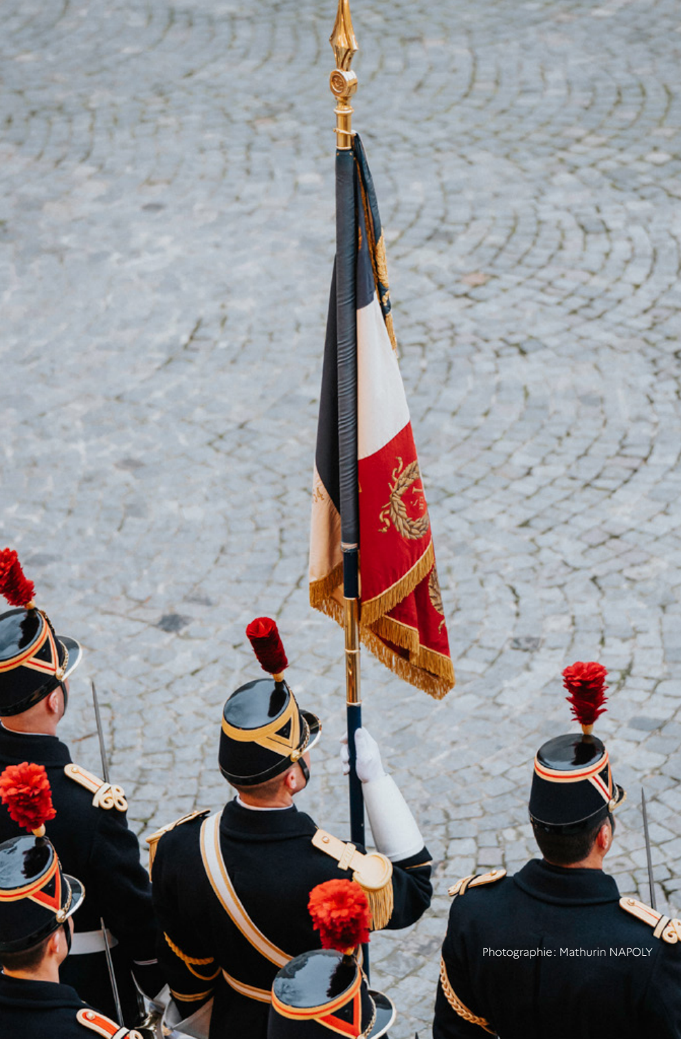
Photographie: Mathurin NAPOLY